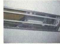
器具内に古い安定器が残っている例